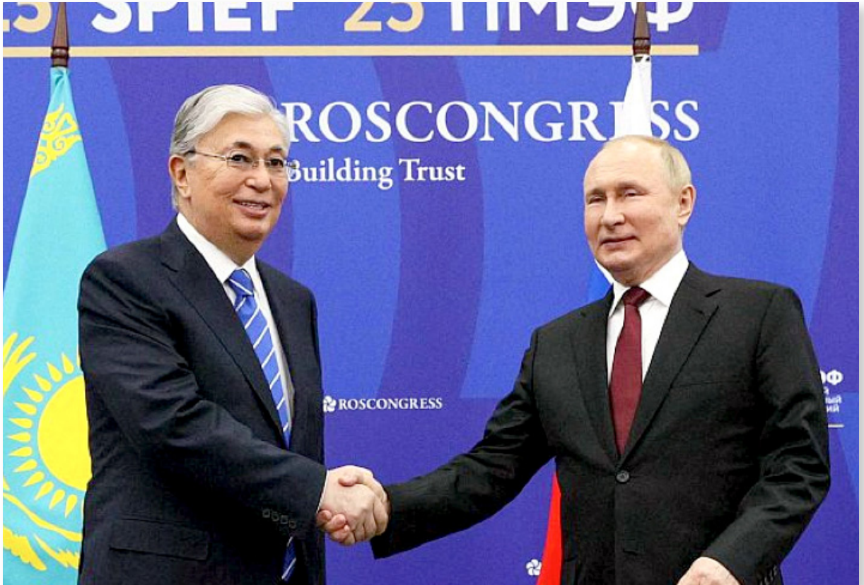
Resim: Kazakistan'ın yeni lideri Tokayev, Rus Başkan Vladimir Putin'le St. Petersburg Ekonomi Forumu'nda

Sadece Rus ve Slav dünyasıyla değil, Batı ülkeleriyle ve doğusundaki büyük komşusu Çin ile de ilişkilerini canlı tutmayı hedefleyen Kazakistan için de Avrasya coğrafi terimi ve Avrasyacılık düşünce kalıbı, 1990'lardan sonra iyiden iyiye kapsayıcı bir şemsiye olarak ele alınmış,